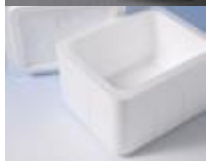
発泡箱(スチロール)