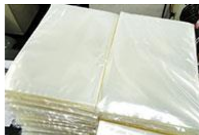
完成した各フィルム製品